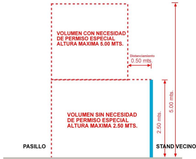
Esquema de elevación lateral